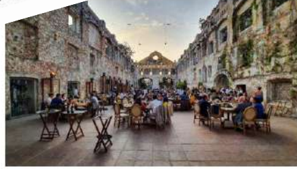
Redéfinir ce qui est (vraiment) utile Foule sentimentale