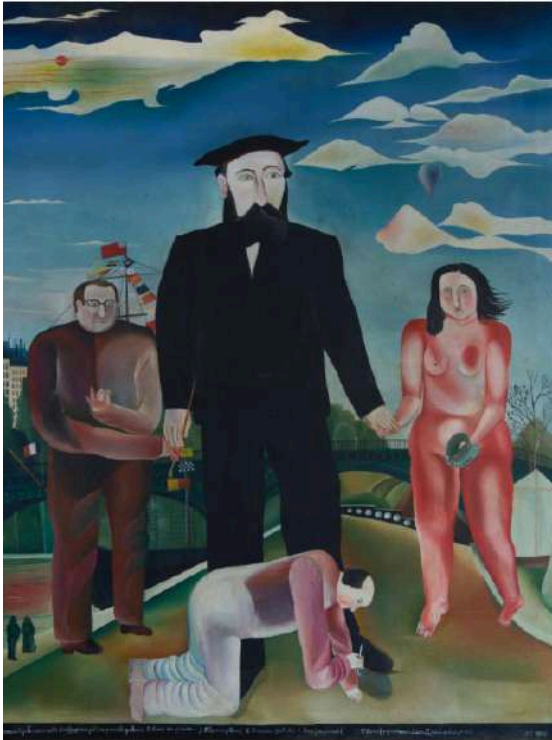
untitled (Self Portrait from L'île Saint Louis) (1970) oil on canvas 133 x 107 cm, 52 1/4 x 42 1/4"