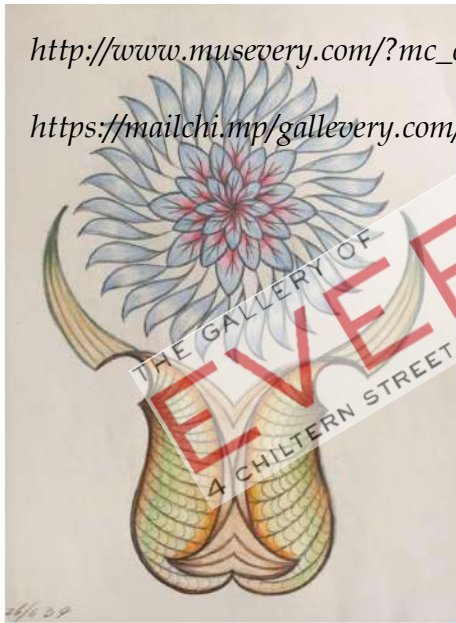
Anna Hackel untitled (1939) colour pencil on paper 30 x 22 cm, 11 1/4 x 8 1/2"

https://mailchi.mp/gallevery.com/cac-takeover?e=bbfcfa8b80