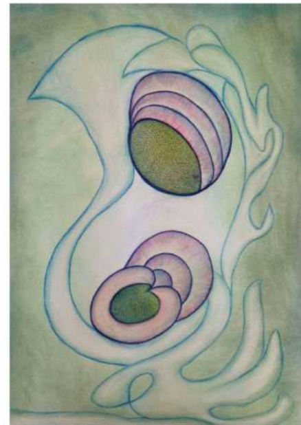
Anna Zemankova untitled (c. 1960) pencil on paper 80 x 60 cm, 31 1/2 x 23 1/2"