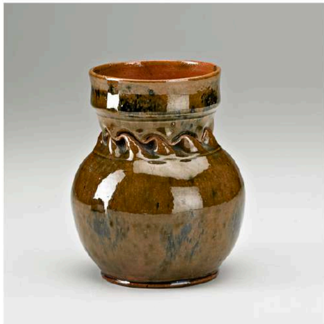
GEORGE E OHR, untitled , c 1895

THE GALLERY OF EVERYTHING 4 CHILTERN STREET, LONDON W1U 7PS +44 207 486 8908