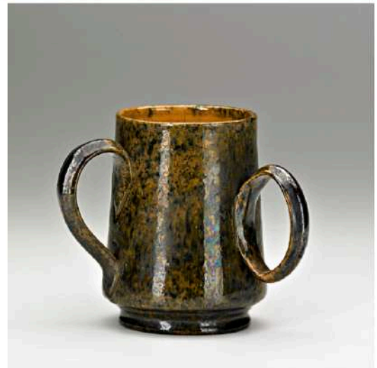
GEORGE E OHR, untitled , c 1900

In the late 1800s, from his home in Biloxi, Mississippi, George Ohr revolutionised ceramics. The clay pots of this self-taught potter were precise and prolific. Their radical shapes and modern glazes marked an important shift in three-dimensional vessel making. As a body of work, they challenged the art establishment and cultural conventions of their day.