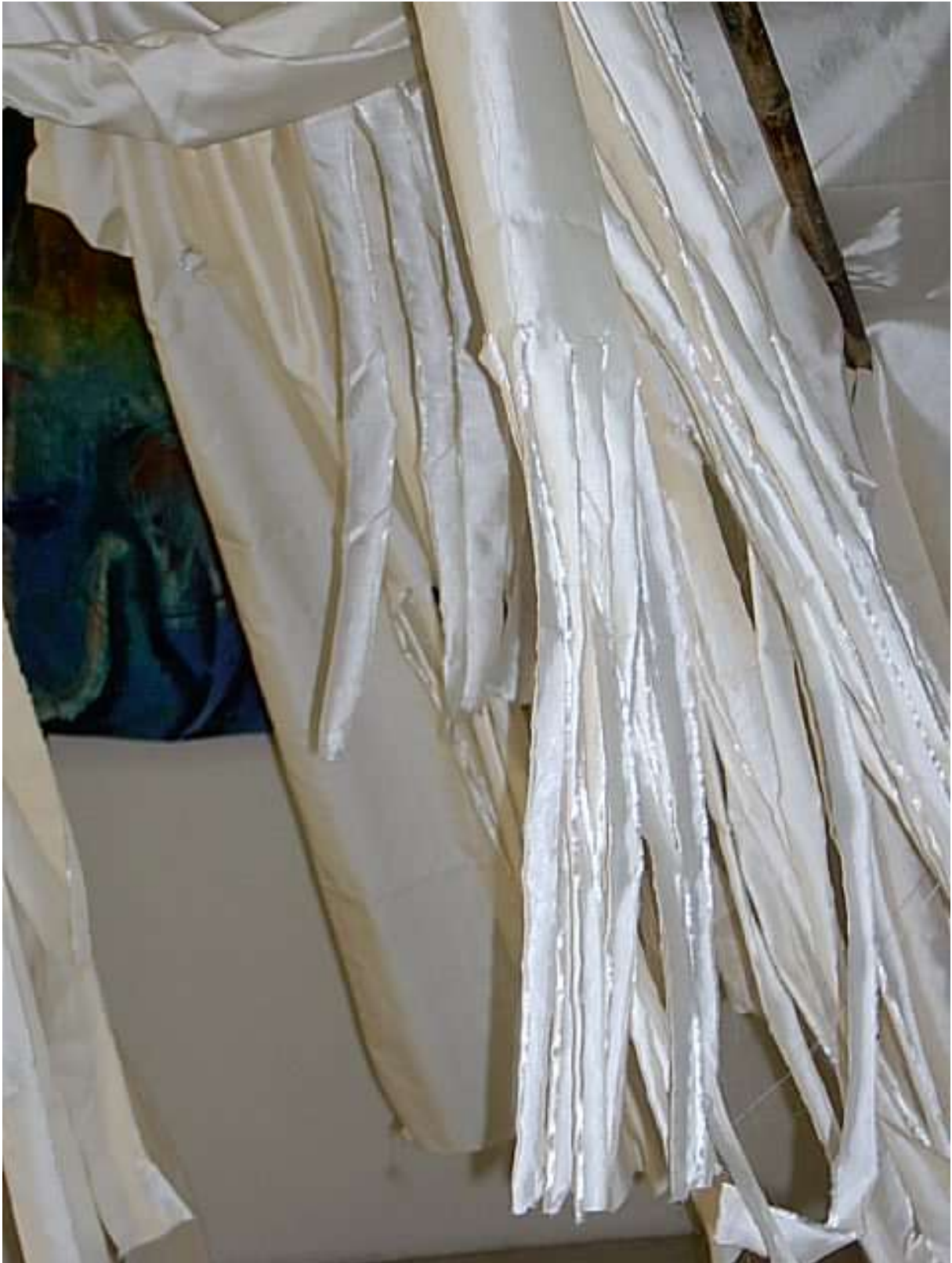
2002 Ho Chi Minh Ville Galery Blue Space