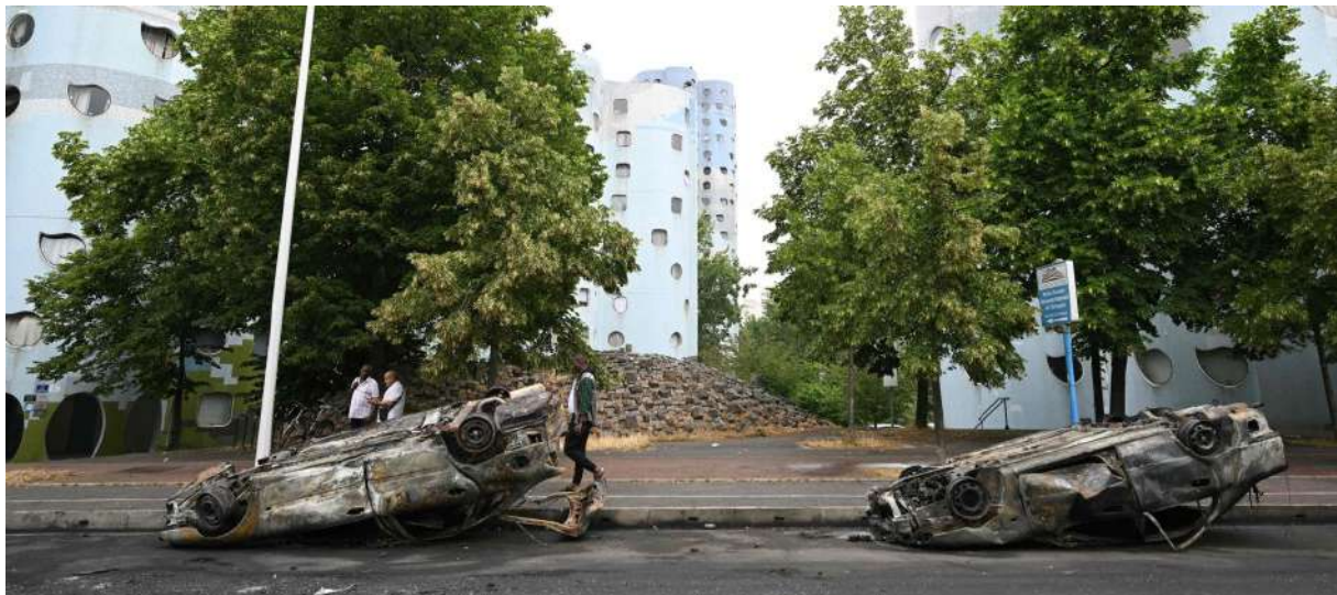
Ausgebrannte Autos in Nanterre

faire comme si rien ne s'était passé. (JCdM)