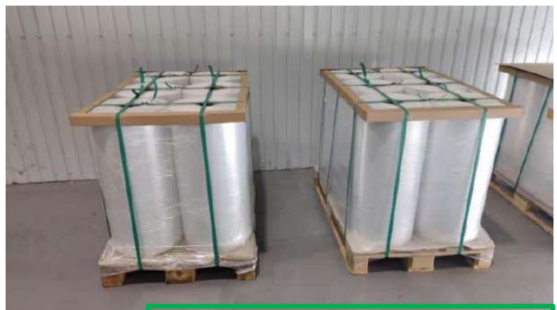
Photo de l'explosif qui était dans le camion qui a sauté sur le pont de Kertch le 8 octobre 2022., explosif d'une puissance équivalente à 21 tonnes de TNT.

« Details: The first strike on the Crimean Bridge took place on the morning of 8 October 2022, the day after Vladimir Putin's 70th