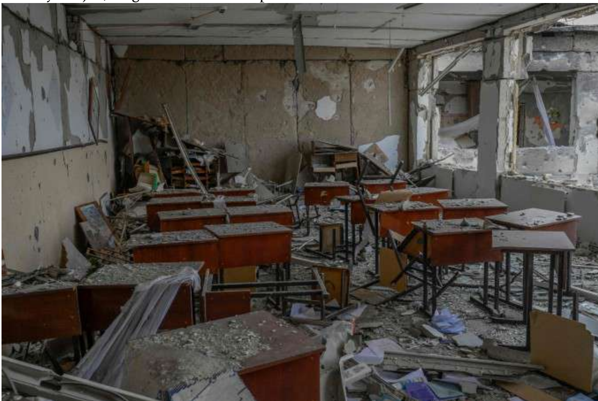
Aus Protest gegen die russische Besatzung kündigten alle Schuldirektoren von Melitopol Mitte der Woche – Klassenzimmer in einer von russischen Raketen getroffenen Schule in Zelenyi Hai, zwischen Cherson und Mykolajiw, :Bild: AFP

entre Nikolaïev et Kherson, l'école a été bombardée comme on peut le voir sur les 2 photos. Néanmoins, en signe de protestation, des enseignants ont décidé d'y faire la classe, donc dans les ruines.