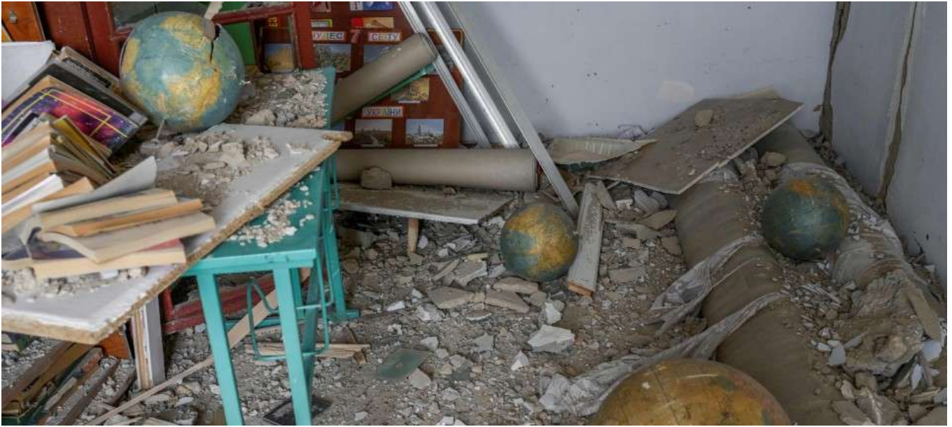
Ein Klassenzimmer in einer von russischen Raketen getroffenen Schule in Zelenyi Hai, zwischen Cherson und Mykolajiw, aufgenommen am 1. April 2022