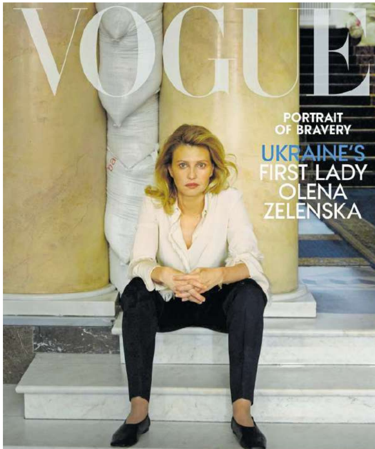
Photo prise dans une station de métro de Kiev. « Bien sûr, c'est mon amour », a confié le président Volodymyr Zelensky . « Mais c'est surtout ma meilleure amie. Olena est vraiment ma meilleure amie. » Les vêtements figurant dans cette série photographique ont été conçus par des créateurs ukrainiens, tels que Better , Six , Hvoja ou Poustovit . »

« Olena Zelenska et le président Volodymyr Zelensky dans le palais présidentiel de Kiyv. »