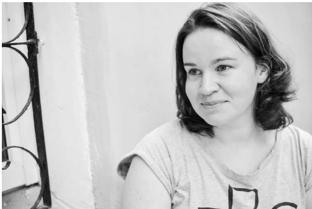
Oksana Pokalchuk Occupation Human rights defender (Wikipedia)

Voilà ci-après Oksana en image (имидж). Je vous épargne tout le texte de son interview. À l'époque où j'allais en Russie puis en Ukraine, je ne pensais pas que ce travail me resservirait 20 ans plus tard. Je croyais que c'était purement et simplement du temps, de l'argent et de l'énergie perdus. https://uk.wikipedia.org/wiki/%D0%A1%D0%BB%D0%B0%D0%B2%D0%B0_%D0%A3%D0%BA%D1%80%D0%B0%D1%97%D0%BD%D1%96! (JCdM)