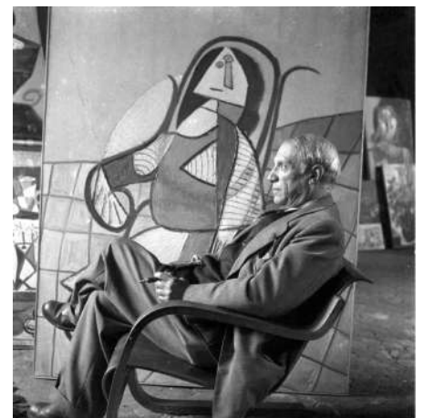
Picasso en 1943