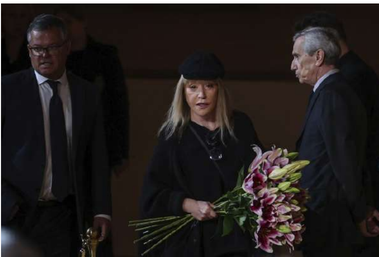
(FAZ) Photo de Alla Pougatchova (73 ans) à l'enterrement de Gorbatchov.

Unmut über Null-Covid-Strategie nach Busunfall in China (NZZ) « 27 Menschen kommen beim Transport in eine Quarantäne-Einrichtung ums Leben » Un bus chinois transportant des chinois vers une quarantaine covid chinoise a un accident sur l'autoroute entre Guiyang et Libo : 27 morts et 20 blessés.