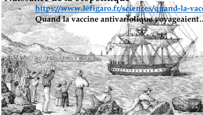
Le Dr Francisco Javier Balmis quitte, le 30 novembre 1803, le port de La Corogne, à bord du Maria Pita, avec 22 orphelins qui se voient inoculer la vaccine pour se la transmettre de bras à bras et la conserver fraîche jusque de l'autre côté de l'Atlantique. vadebarcos.net/Boletin del Centro Naval

https://www.lefigaro.fr/sciences/quand-la-vaccine-antivariolique-voyageait-dans-des-bras-d-enfants-20211121 Quand la vaccine antivariolique voyageaient... dans des bras d'enfants