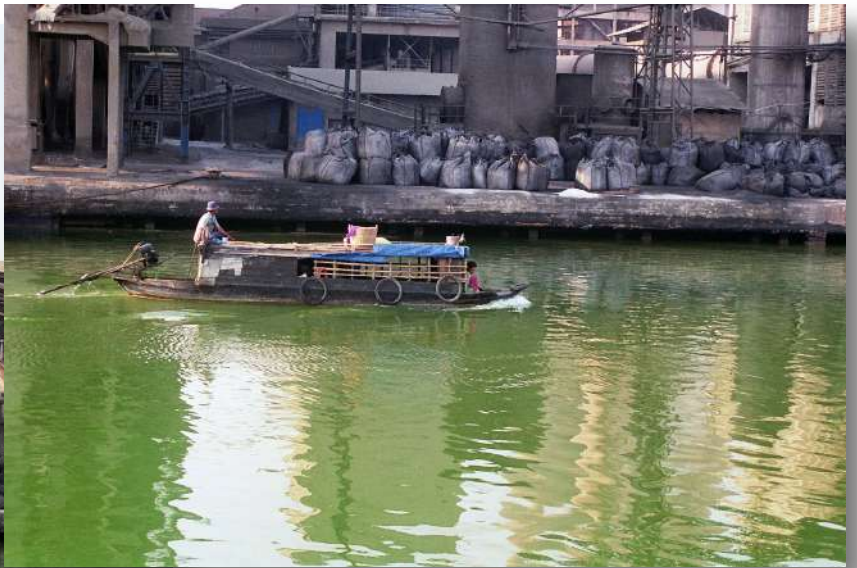
Exploitation de la latérite en aval de Chau Doc