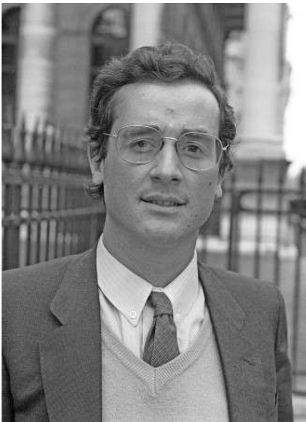
Avec photo de François Hollande à sa sortie de l'ENA en prime