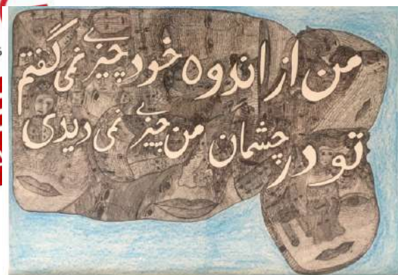
Mehdiad Reshidi untitled (I did not talk about my sorrow and you did not see anything in my eyes), (c) 2015 ink and pastel on paper 88.5 x 93.1 cm / 25 x 39 in

https://mailchi.mp/gallevery.com/intersect-21?e=bbfcfa8b80