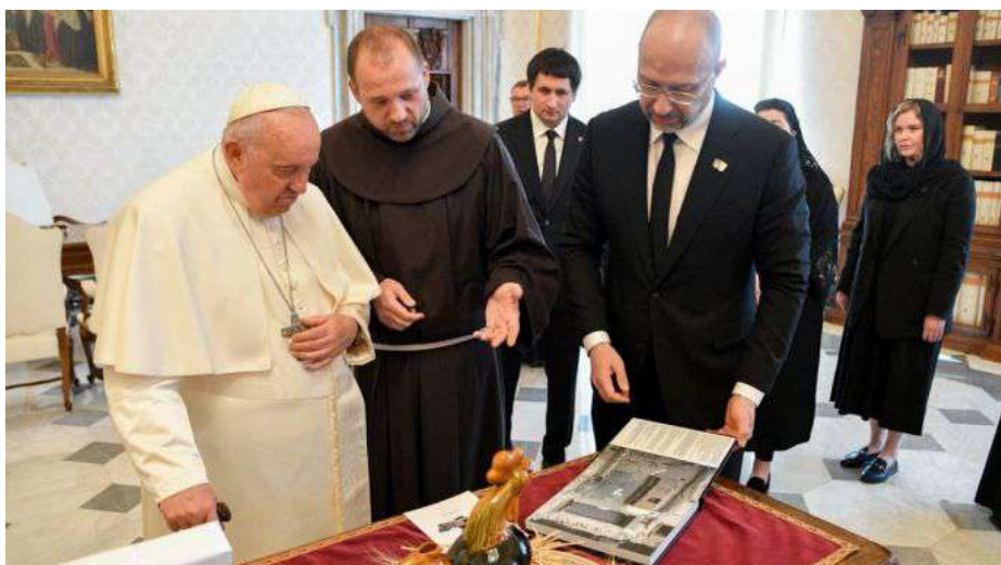
Ukraine's Prime Minister gives Pope photo album depicting Russian crimes in Ukraine (UKRAINIAN PRAVDA)

Le premier ministre ukrainien Denis Shmygal a offert au Pape un album de photos des atrocités commises par les russes en Ukraine.