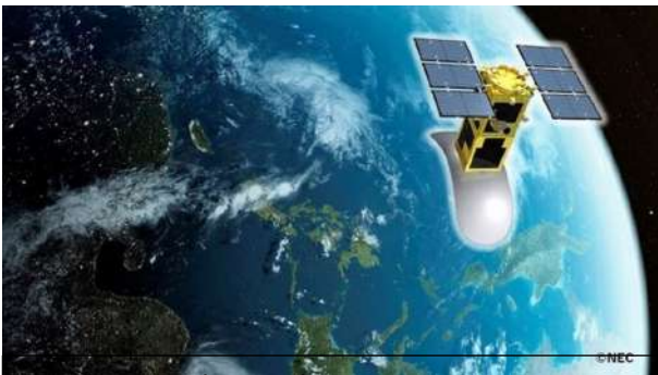
Le Vietnam devrait lancer un premier satellite radar en 2025

https://youtube.com/@hervefayet7507?si=C4FeAHikht-DcTJE