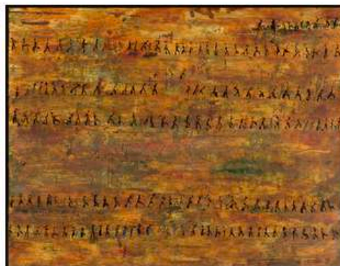
Colette Leinman, N'homer , 130/95 cm, oil on canvas, 2012, private collection ; © Colette Leinman