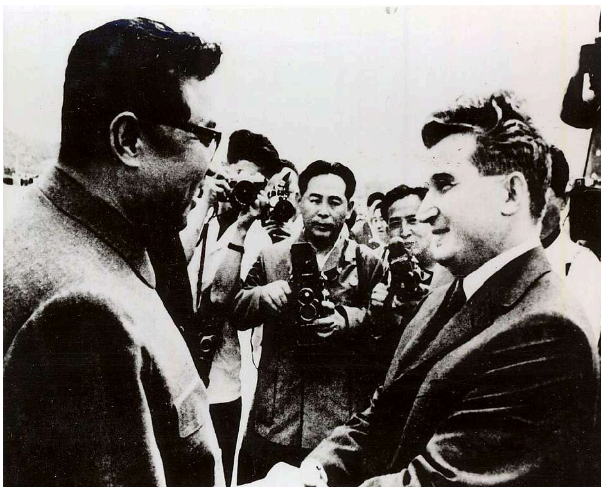
Nicolae Ceausescu and Kim Il Sung during the party and state visit to the DPR Korea, 15 June 1971