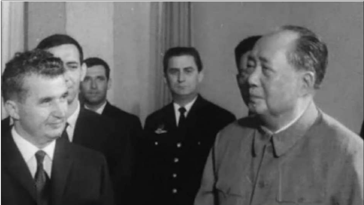
M. Mao Tsé-toung encourage M. Ceausescu à travailler pour l'unité contre les impérialistes (Le Monde, 5 juin 1971)